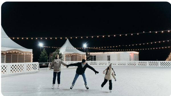
Plusieurs patinoires sont ouvertes après le 25 décembre : celle de Calais, d'Hazebrouck...

Quelques idées de sorties sur la côte et dans les terres.