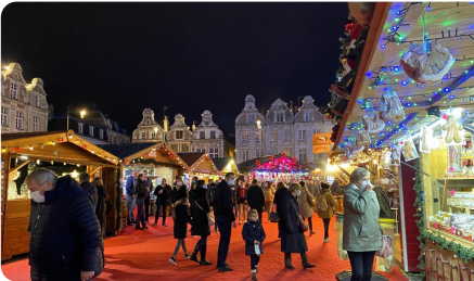
Le marché de Noël d'Arras ferme ses portes vendredi 30 décembre.

Plus que quelques jours pour profiter du marché de Noël d'Arras ( https://www.nordlittoral.fr/159625/article/2022-12-03/arras-ou-se-garer-correctement-en-venant-la-ville-de-noel ). Vin chaud, délices sucrées et salées, grande roue, carrousel vous attendent sur la Grand'Place, la place des Héros, la place du Théâtre et la place d'Ipswich.